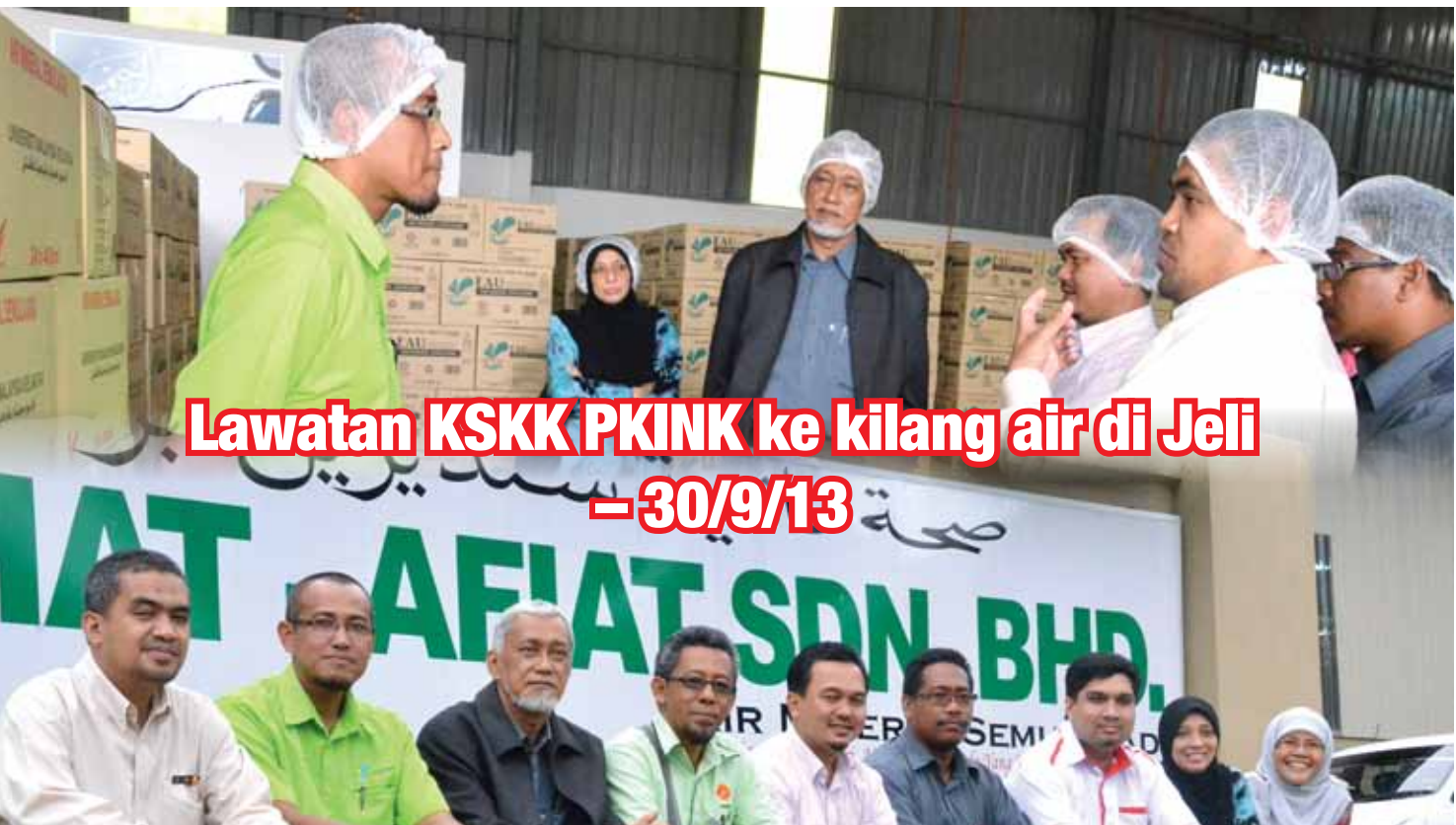
Lawatan KSKK PKINK ke kilang air di Jeli – 30/9/13