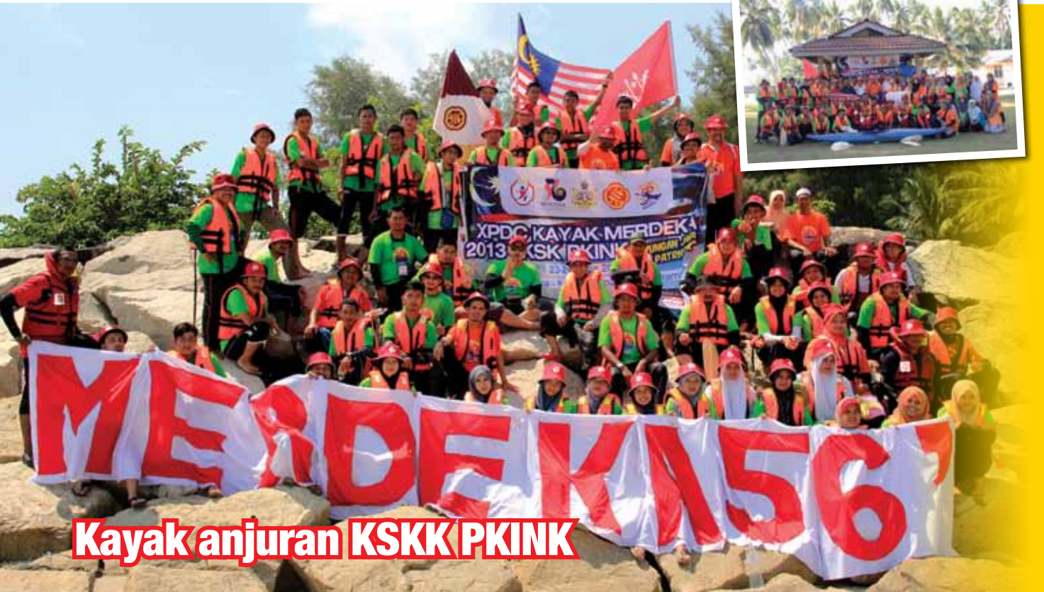
Kayak anjuran KSKK PKINK