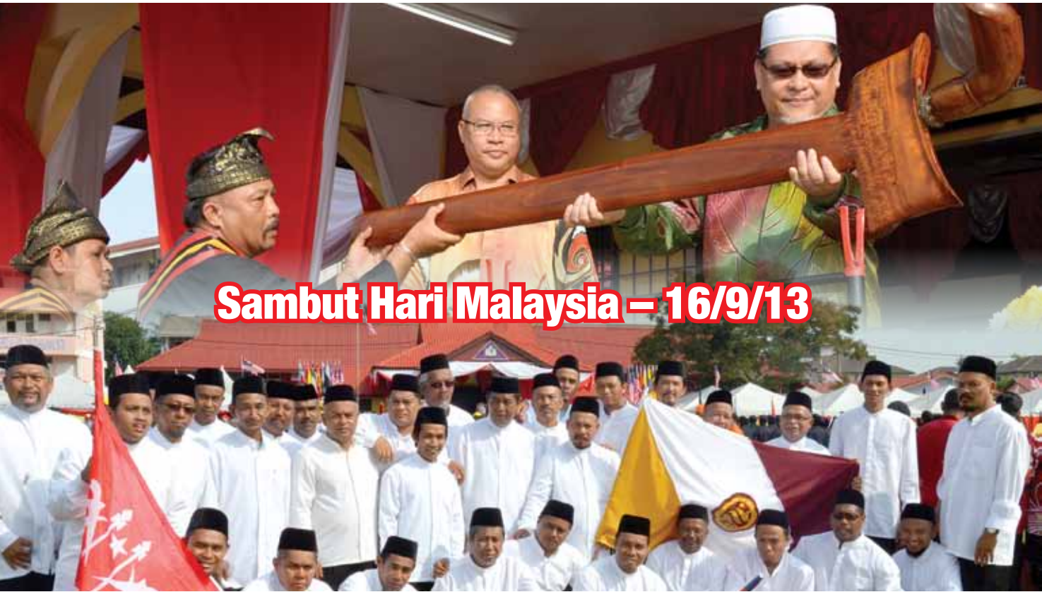
Sambut Hari Malaysia – 16/9/13