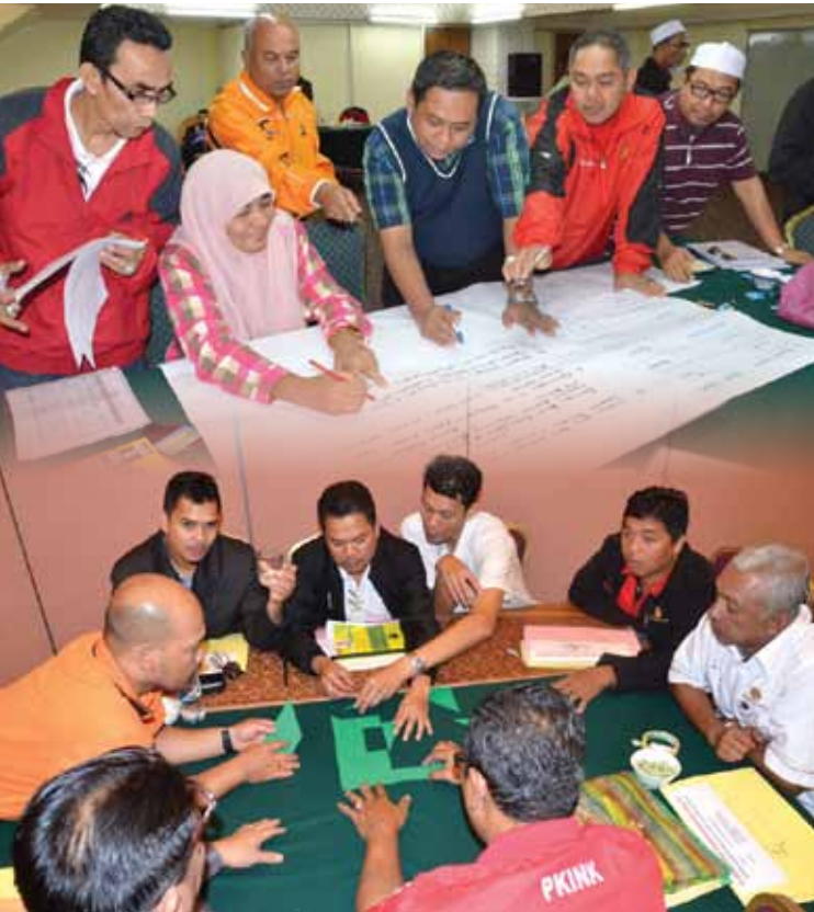
Kursus anjuran PKINK (Team Building, Penjawat Awam Cemerlang & Pembangunan Kemahiran Sahsiyah)