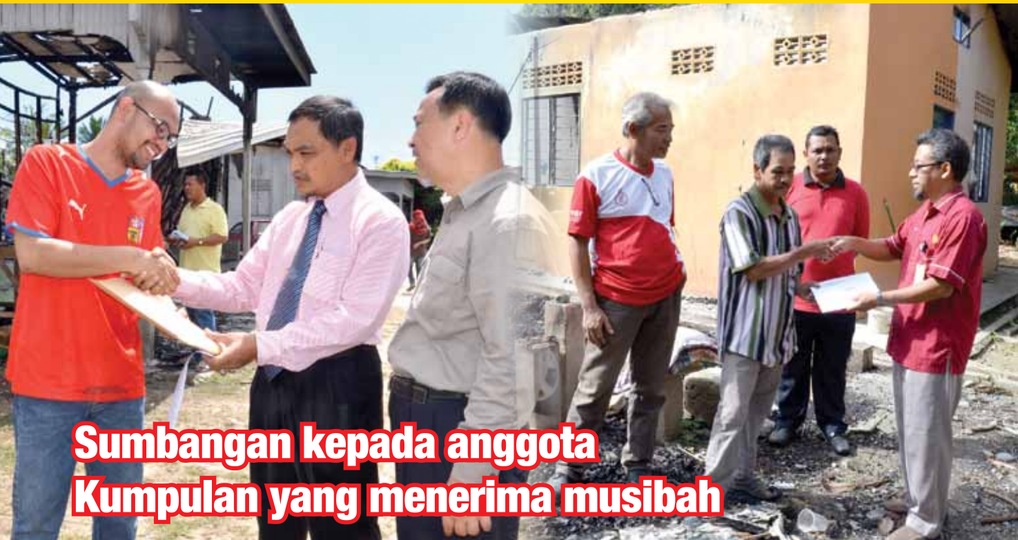
Sumbangan kepada anggota Kumpulan yang menerima musibah