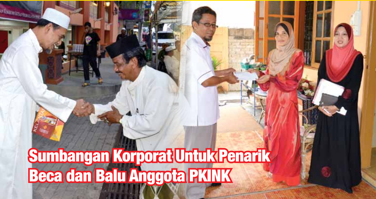
Sumbangan Korporat Untuk Penarik Beca dan Balu Anggota PKINK