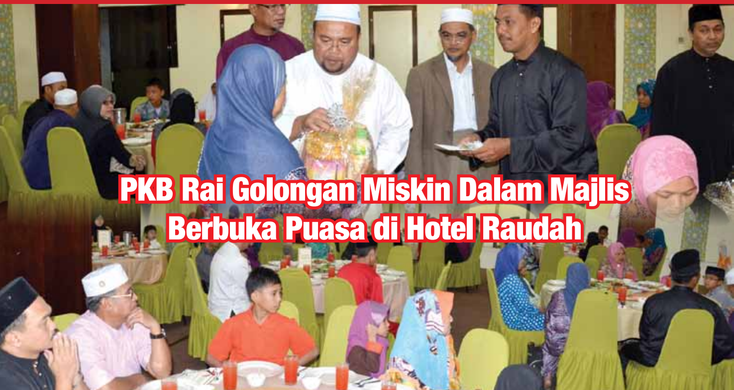
PKB Rai Golongan Miskin Dalam Majlis Berbuka Puasa di Hotel Raudah