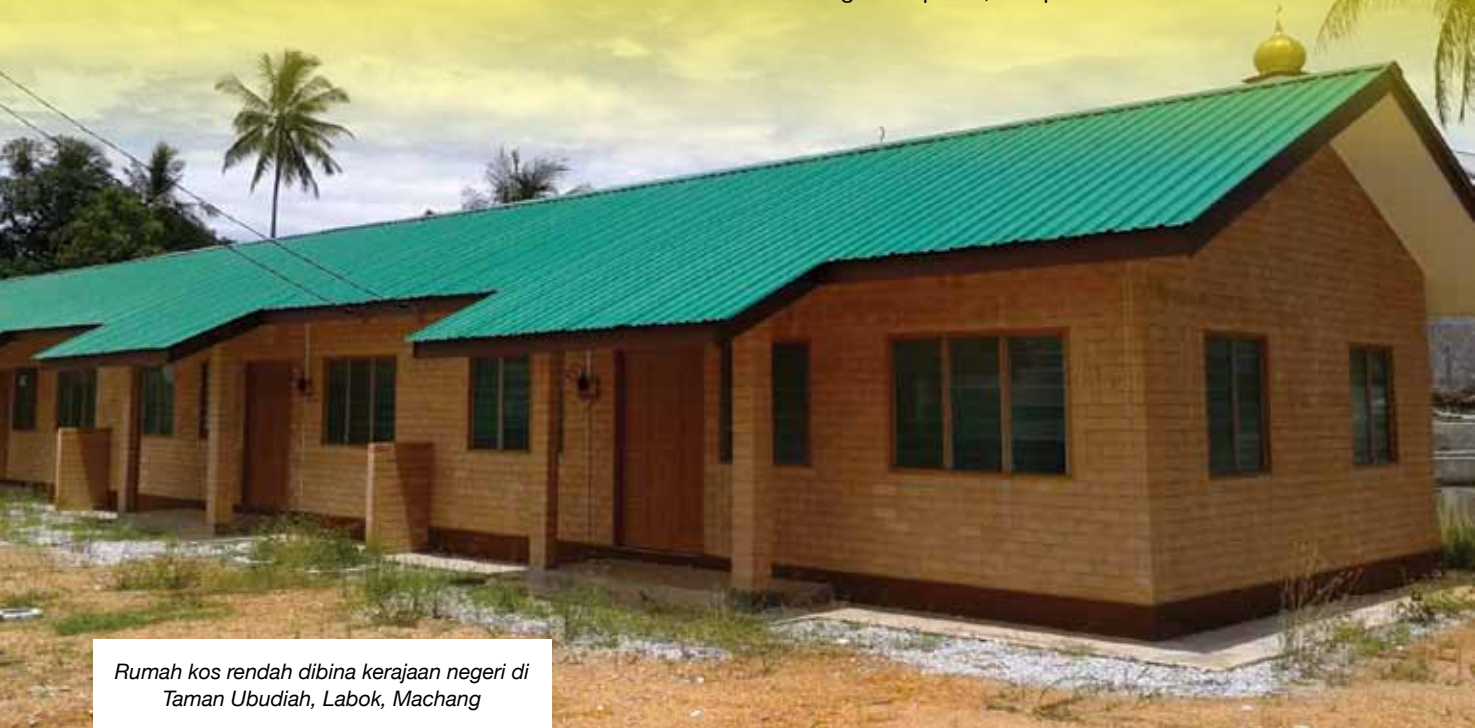
Rumah kos rendah dibina kerajaan negeri di Taman Ubudiah, Labok, Machang

"Sasaran 5,000 dibuat memandangkan sehingga sekarang terdapat 6,000 permohonan memiliki rumah