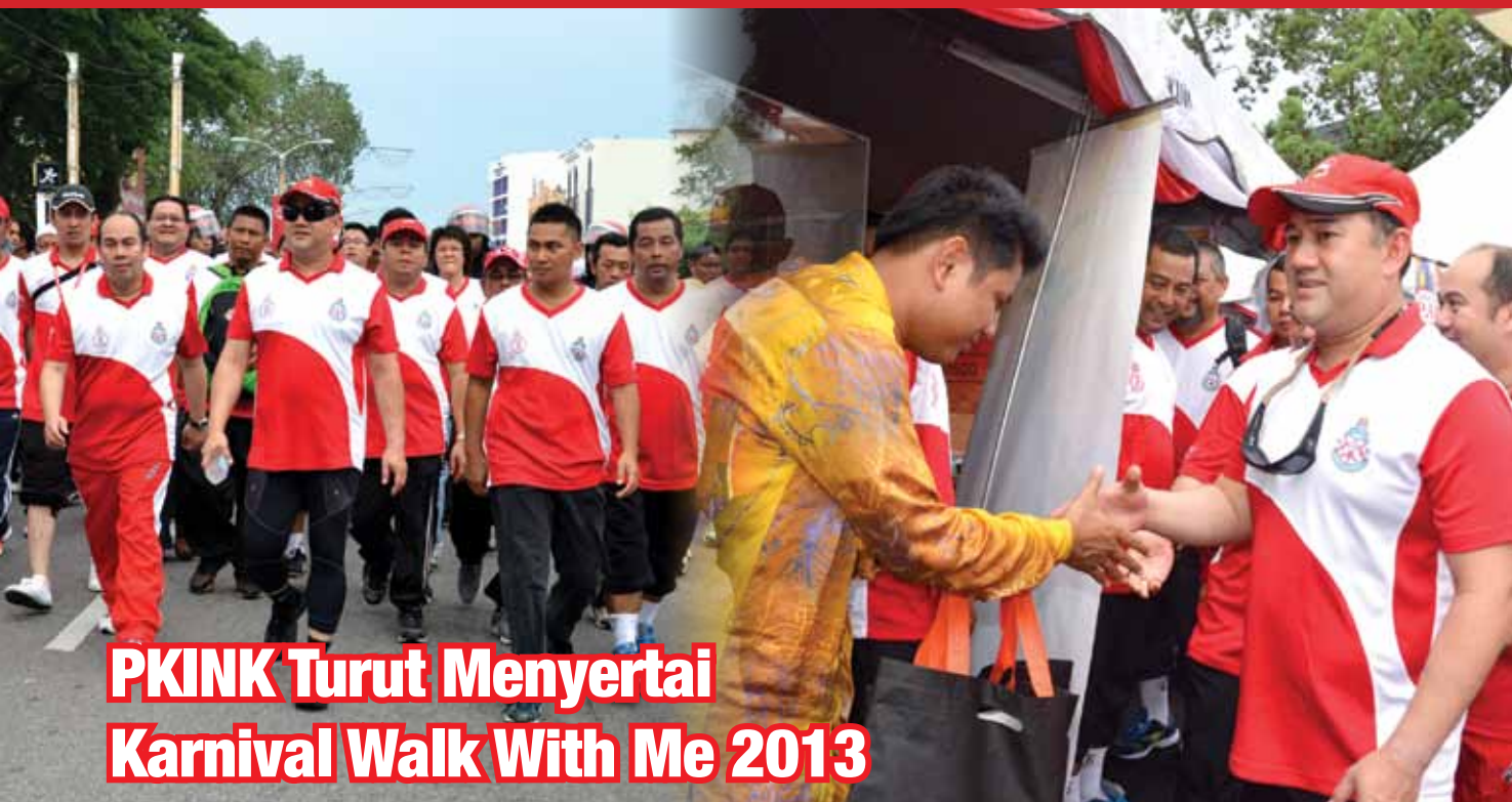
PKINK Turut Menyertai Karnival Walk With Me 2013