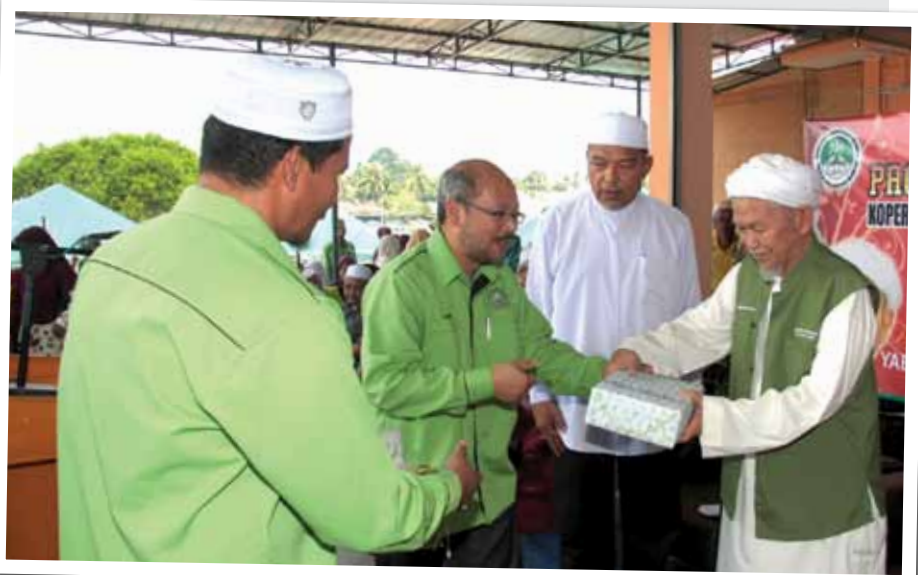
Tuan Guru Nik Abdul Aziz menyampaikan cenderahati sumbangan Ladang Rakyat kepada seorang penerima

2 Membuka Ar Rahn (sistem gadaian Islam). Ar Rahn dicetus di Kelantan pada 1992 dengan menawarkan pilihan kepada orang ramai untuk menggadai barangan kemas mereka bagi mendapatkan tunai segera. Sejak kewujudan Ar Rahn kerajaan negeri tidak lagi mengeluarkan lesen premis baru bagi pusat gadaian konvensional yang mengekalkan sistem riba. Sehingga sekarang Ar Rahn (Rahn) berkembang pesat. Malah Ar Rahn mempunyai cawangan hampir di seluruh negara. Banyak institusi seperti Yayasan Pembangunan