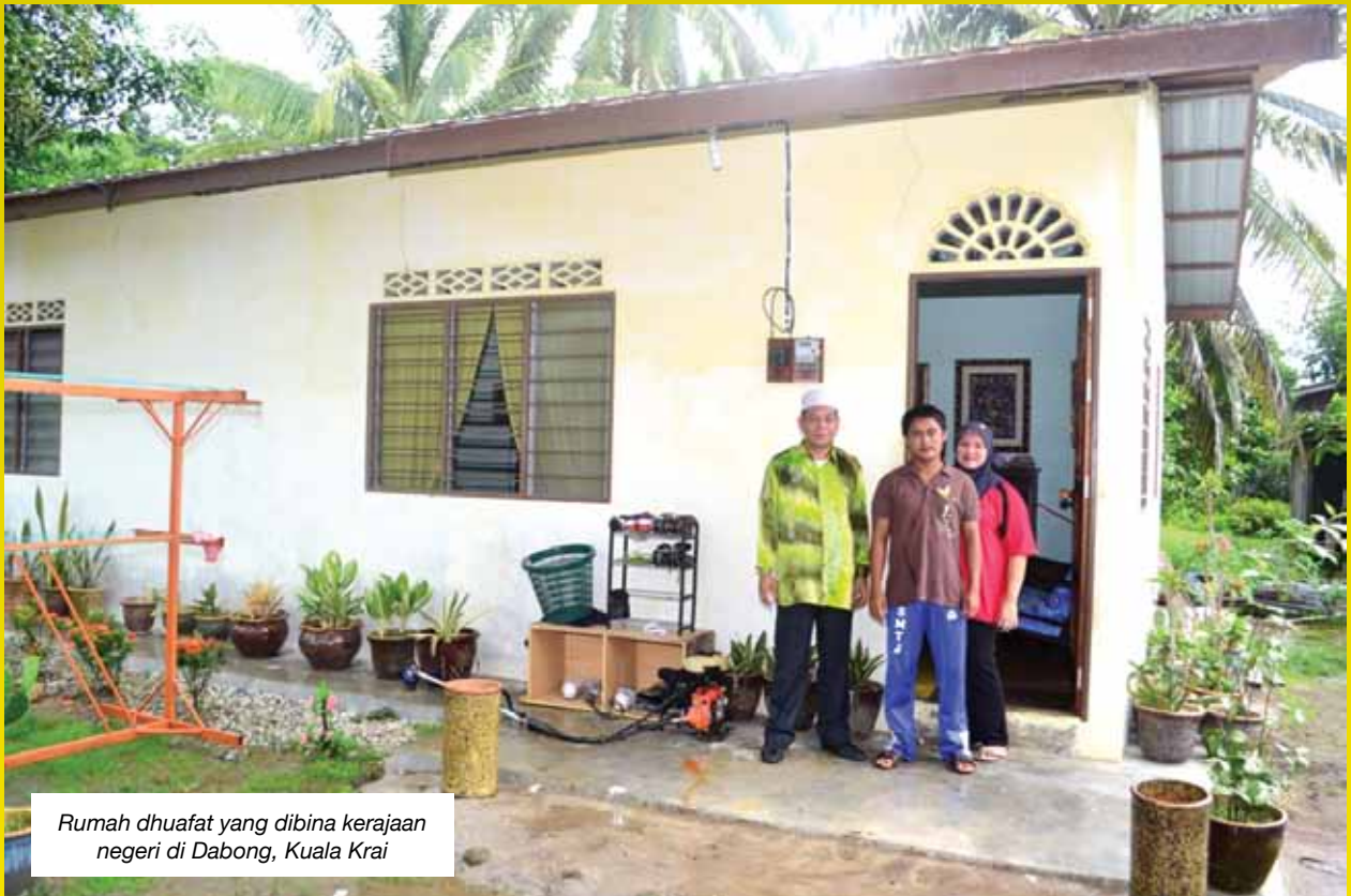
Rumah dhuafat yang dibina kerajaan negeri di Dabong, Kuala Krai

(206 unit) dan Al Waqf Garden Suites (294 unit).