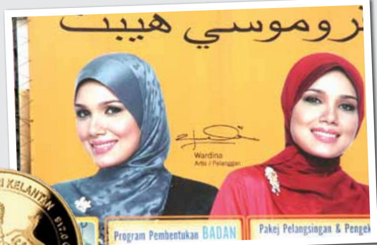
Iklan wanita menutup aurat hanya dibenarkan di Kelantan

sebagai stok penyimpanan nilai. Wang siling Dinar dan Dirham mendapat sambutan hangat ketika mula diperkenalkan. Sejak usaha itu dilakukan Dinar dan Dirham mulai dikomersialkan pelbagai pihak sebagai satu bentuk pelaburan baru. Kerajaan negeri juga mewujudkan Kelantan Golden Trade bagi mengurus pengeluaran Dinar dan Dirham.