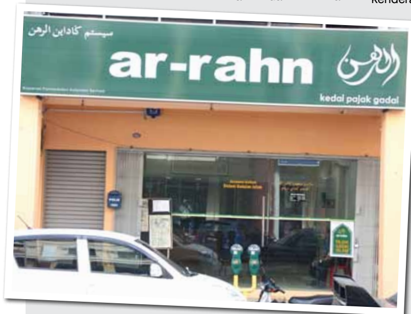
Kedai pajak gadai Islam (Ar Rahn) milik Pemodal Kelantan Bhd

10 Kerjasama agensi kerajaan negeri dan swasta. Kerajaan negeri menggalakkan agensi dan pihak berkuasa tempatan mengadakan kerjasama dengan syarikat-syarikat swasta bagi membangunkan premis perniagaan dan bandar baru. Langkah tersebut membuah kejayaan memberangsangkan apabila bandar baru banyak diwujudkan di Kelantan termasuk di Kota Bharu, Pasir Mas, Tumpat, Kuala Krai, Gua Musang, Bachok, Rantau Panjang, Machang dan Tanah Merah. Di Kota Bharu terdapat empat kawasan pertumbuhan baru iaitu di Lembah Sireh, Kubang