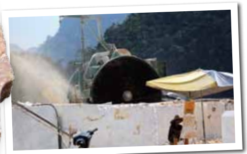
Mesin gergasi digunakan bagi memecah bukit batu marmar

kilang memproses batu marmar selepas tiga tahun kuari tersebut beroperasi.