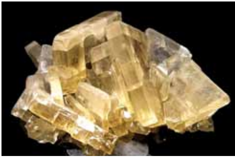
Kristar barit yang dihasilkan daripada batu barite