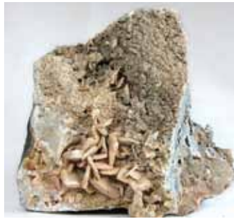
Contoh batu barit yang belum diproses