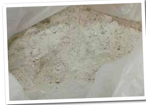
Serbuk felspar yang beralkali tinggi dihasilkan di kuari Tanah Putih.

Perlombongan feldspar yang dijalankan Kelstone dengan kerjasama syarikat swasta di Mukim Pulai, Daerah Galas, Gua Musang. Perlombongan itu mula beroperasi