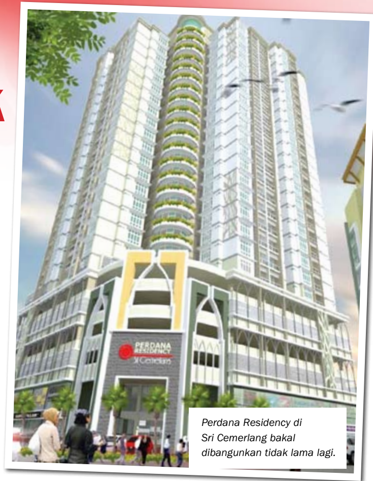
Perdana Residency di Sri Cemerlang bakal dibangunkan tidak lama lagi.

Setiap unit apartment di Perdana Residency ditawarkan dengan harga RM140,000 ke atas. Manakala dua tingkat "pent house" di koridor paling atas ditawarkan dengan harga RM1 juta. Projek tersebut terletak bersebelahan ibu pejabat Celcom dan tidak jauh Jalan Kebun Sultan. Ia bakal menjadi mercu tanda baru apabila siap pada 2014. Perdana Residency dianggar membabitkan kos sebanyak RM44.3 juta. Pembinaannya akan