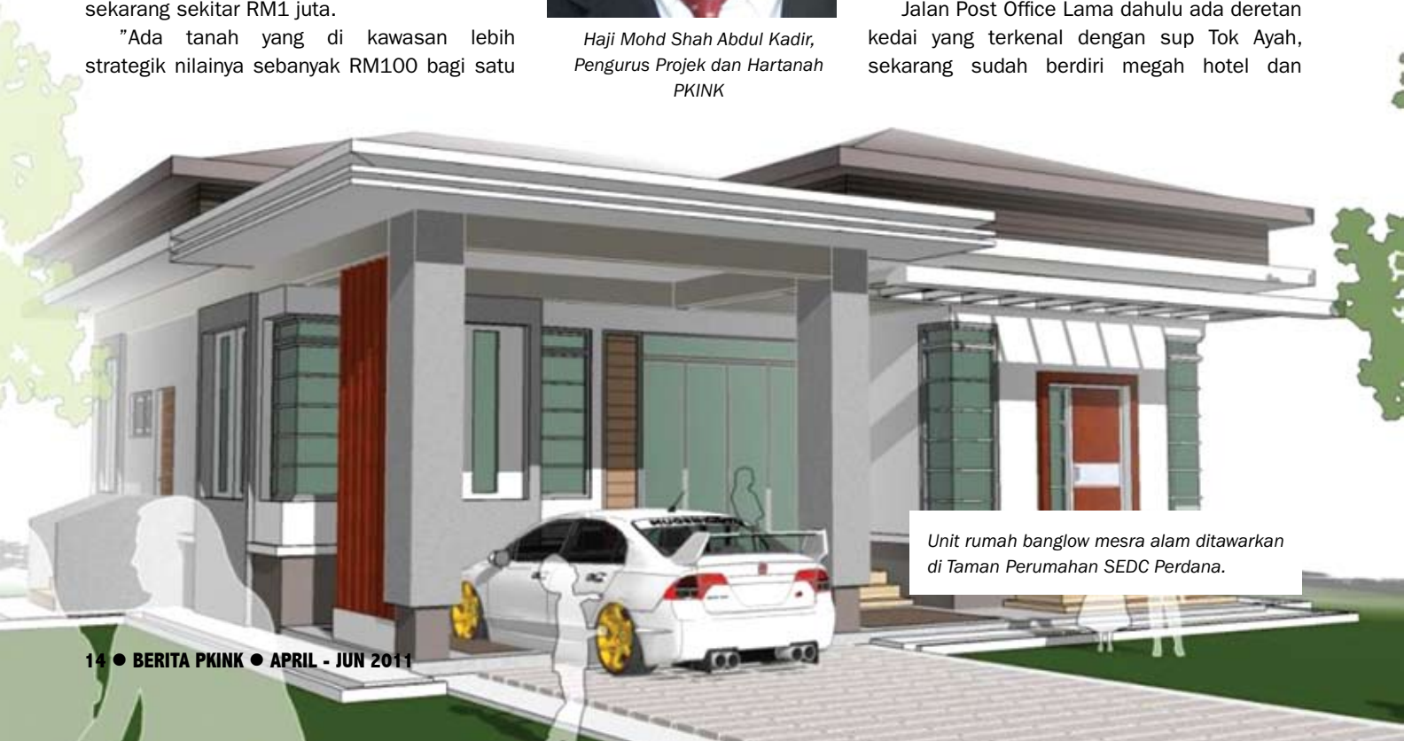
Unit rumah banglow mesra alam ditawarkan di Taman Perumahan SEDC Perdana.

Jalan Post Office Lama dahulu ada deretan kedai yang terkenal dengan sup Tok Ayah, sekarang sudah berdiri megah hotel dan