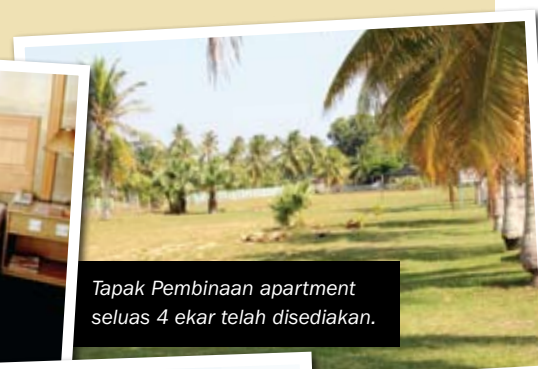
Tapak Pembinaan apartment seluas 4 ekar telah disediakan.