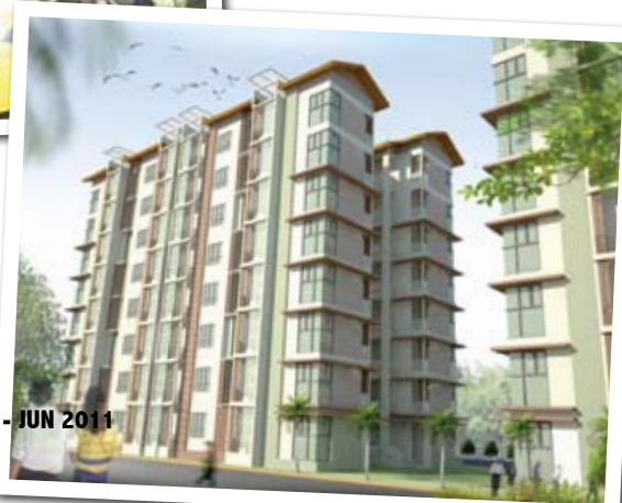
Aparment Service bakal dibangunkan berhampiran Perdana Resort