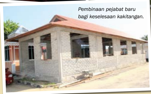
Pembinaan pejabat baru bagi keselesaan kakitangan.