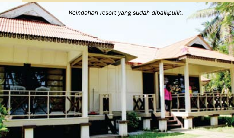
Keindahan resort yang sudah dibaikpulih.

PENKALAN CHEPA: Persaingan dalam menarik pelancong untuk bertandang ke Perdana Resort semakin ketara setelah kewujudan pelbagai resort berhampiran pantai, namun dengan pengalaman lebih 20 tahun, Perdana Resort masih mampu bertahan dan kini semakin popular kepada pelancong dalam dan luar negeri.