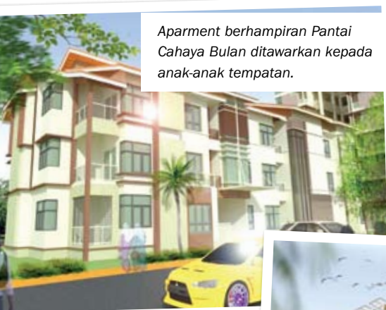
Aparment berhampiran Pantai Cahaya Bulan ditawarkan kepada anak-anak tempatan.

"Kerja-kerja m e n a m b u n tanah sedang d i j a l a n k a n