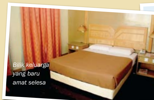
Bilik keluarga yang baru amat selesa

“Kita yakin projek pembinaan Taman Tema tersebut akan menjadi kenyataan dan Perdana Resort dalam masa yang sama akan menyediakan apartment dan ini akan meningkatkan kedatangan pelancong ke Pantai Cahaya Bulan pada masa depan”katanya lagi. 🍷