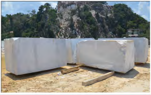
Oleh: Aslani M

BIAR pun masih dinafikan hak royalti petroleum sejak 2004 sehingga sekarang, namun kerajaan negeri tidak pernah berputus asa. Perjanjian yang ditandatangani antara Menteri Besar Kelantan dan Petronas pada 1975 tetap terus dipertahankan.