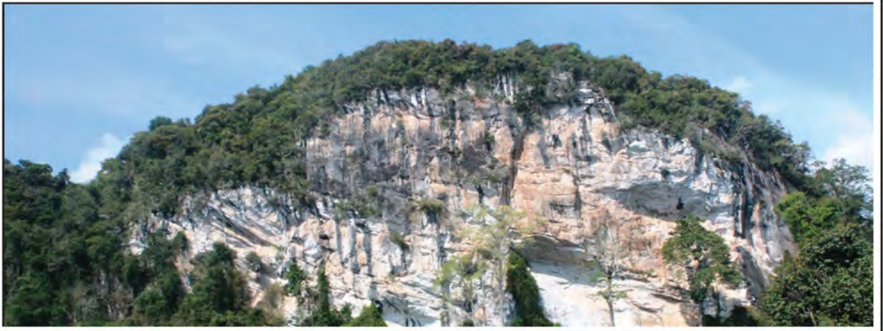
Oleh: M Faqih

MENJEJAKI kaki ke Gua Musang tentunya membuatkan kita terpegun melihat bukit batu kapur dan gua yang terpacak di sana-sini. Pemandangannya begitu menakjubkan sekali.