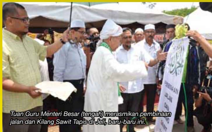
Tuan Guru Menteri Besar (tengah) merasmikan pembinaan jalan dan Kilang Sawit Tapis di Jeli, baru-baru ini.