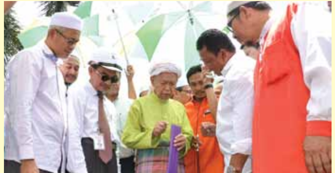
Tuan Guru Menteri Besar (tengah) ketika merasmikan pemasangan kabel optik bagi mempercepatkan kelajuan internet di Kelantan, baru-baru ini