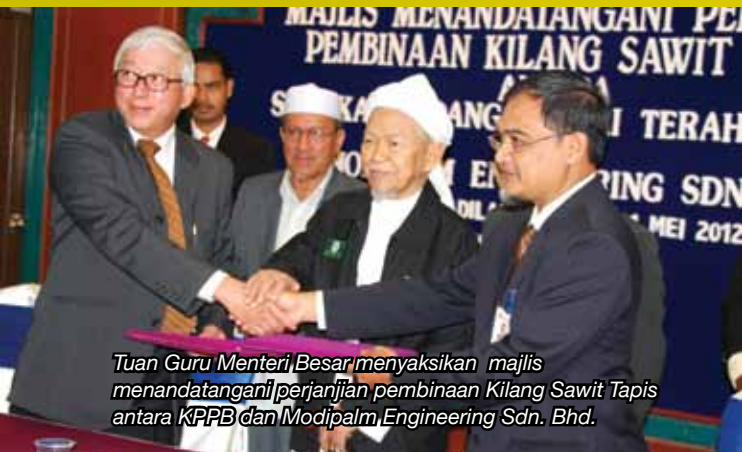
Tuan Guru Menteri Besar menyaksikan majlis menandatangani perjanjian pembinaan Kilang Sawit Tapis antara KPPB dan Modipalm Engineering Sdn. Bhd.