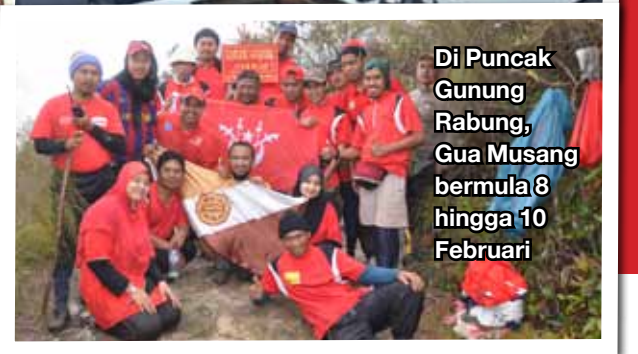
Di Puncak Gunung Rabung, Gua Musang bermula 8 hingga 10 Februari