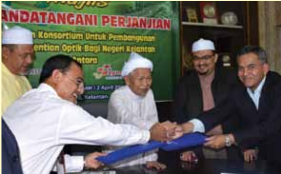
Tuan Guru Menteri Besar menyaksikan majlis menandatangani perjanjian penubuhan konsortium pembangunan Jaringan Gantian Optik antara IQSB dan Symphonet Sdn. Bhd.