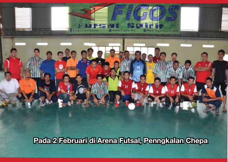
Pada 2 Februari di Arena Futsal, Pengkalan Chepa

Kelab Sukan dan Kebajikan PKINK (KSK PKINK) Berjaya menganjurkan beberapa program yang menguji ketabahan fizikal dan mental serta Berjaya memupuk semangat kerjasama sesama ahli.