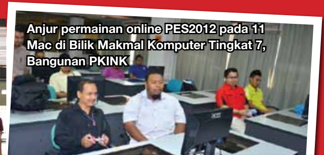
Anjur permainan online PES2012 pada 11 Mac di Bilik Makmal Komputer Tingkat 7, Bangunan PKINK