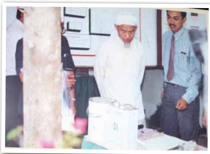
Menteri Besar melawat Ladang Sungai Terah, Gua Musang pada 1992.

Selain itu terdapat seramai 200 lagi tenaga buruh yang bekerja di ladang sawit, di mana kesemuanya dari Indonesia.