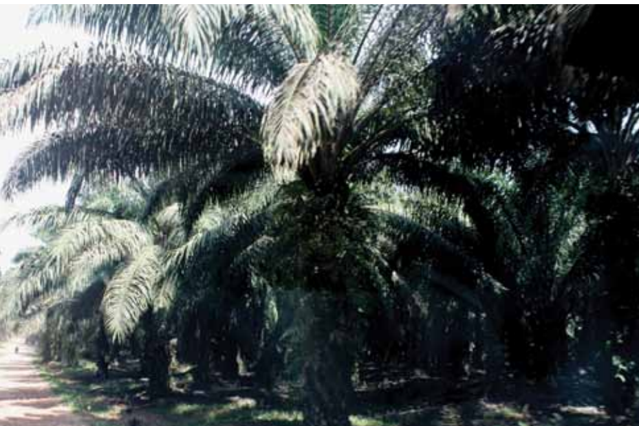
Pokok kelapa sawit hidup subur di Ladang Sungai Terah.