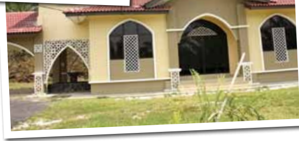
Banglow yang disediakan khas untuk tetamu.