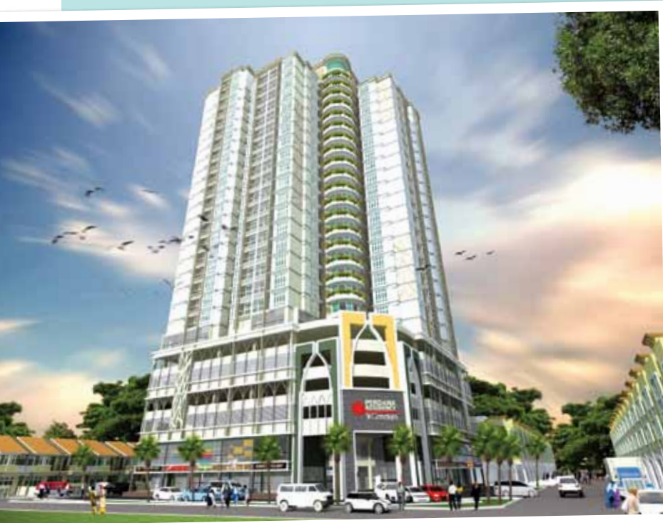
D'Perdana Seri Cemerlang

Selain itu, Kelantan akan terus dihujani dengan pembinaan melalui projek Pembangunan Pantai Irama Resort. Projek di lot PT 18 dan PT 19 di Pantai Irama Resort ini akan