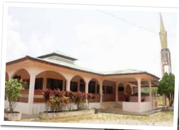
Masjid Ladang Sungai Terah terletak di tepi jalan Gua Musang - Jeli.

“Sebab itulah di setiap kawasan perumahan pekerja turut disediakan surau bagi membolehkan mereka menunaikan solat dengan selesa dan mengikuti kuliah agama,” katanya.