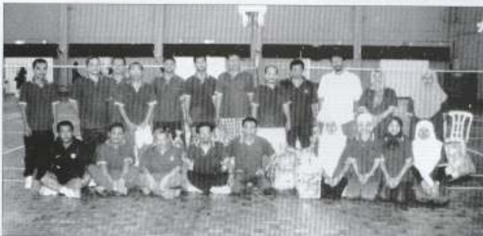
Para peserta yang mengumpul bahagian di dalam pertandingan badminton berpasukan.