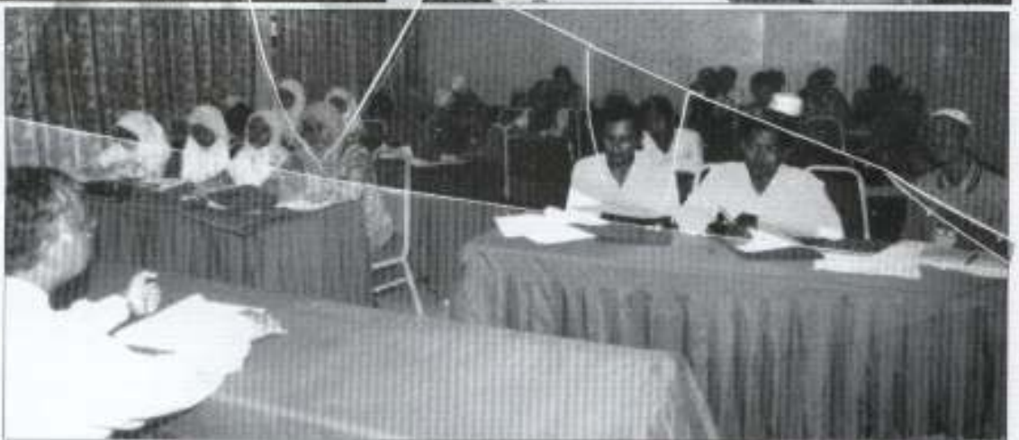
Peserta-peserta Kursus Asas Belia Niaga 2003 sedang mengikuti kursus.