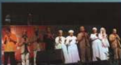
Persembahan kebudayaan Dapud Dapud, Ransel dan Dapud