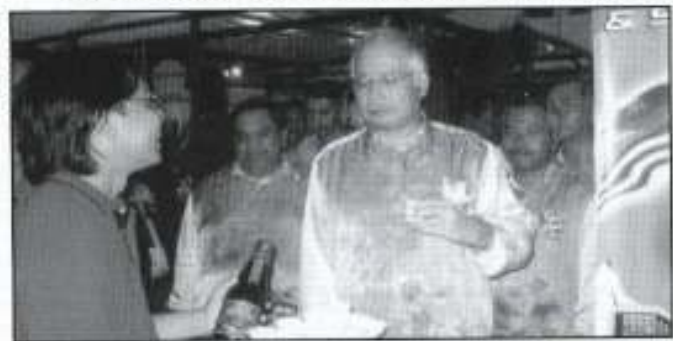
Kunjungan Timbalan Perdana Menteri ke Gora MMSB sempena Pameran SAIF 2005