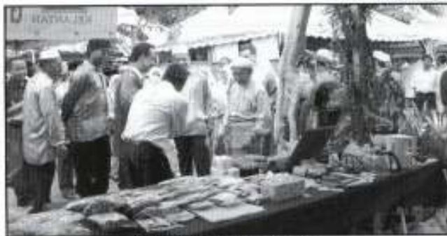
YAB Tuan Guru MBI melihat gerai-gerai