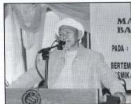
YAB Tuan Guru Dato' Hj. Nik Abd. Aziz b. Nik Mat Menteri Besar Kelantan merasmikan upacara

Pembinaan pejabat baru ini juga bakal memacu KPK ke persada lebih gemilang dengan menonjolkan ketrampilan imej korporat KPK.