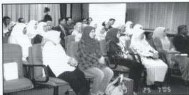
Rombongan PKINK berbentukimat semasa lawatan ke PKEN Sarawak

Lawatan singkat ke bumi kenyalang membawa seribu satu kenangan yang tidak dapat kami lupakan. Bersyukur kehadiran Illahi