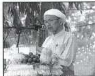
YAB Tuan Guru MBI memandangi HPPN Peringkat Negeri

Mengikuti pihak jawatankuasa penganjuran, acara ini dianggap paling berkesan bagi memperkenalkan produk-produk pertanian keluaran negeri Kelantan dan berkemungkinan akan diadakan dua (2) kali setahun memandangkan sambutan orangramai amat menggalakkan.