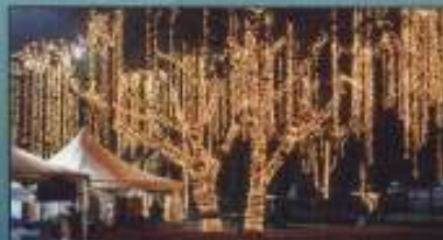
Struktur mainan budaya Kota Bharu yang diterangi cahaya