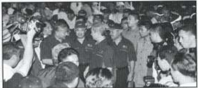
Kunjungan Perdana Menteri ke Pameran HPPNK 2005 mendapat perhatian orang ramai

dan juga untuk menarik pelaburan dan perdagangan baru. Walaupun sambutan orang ramai ke atas pameran SAIF kurang memberangsakan, namun penyertaan pada dua acara ini telah berjaya menaikkan nama dan imej PKINK serta Negeri Kelantan khususnya.