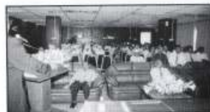
Antara Anggota PKINK yang hadir