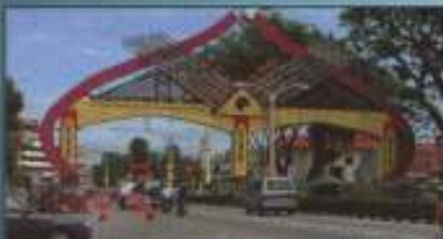
Pada Gerbang Mulu Perbarisan Kota Bharu Bandar Raya Islam di jalan utama menuju ke pusat bandar