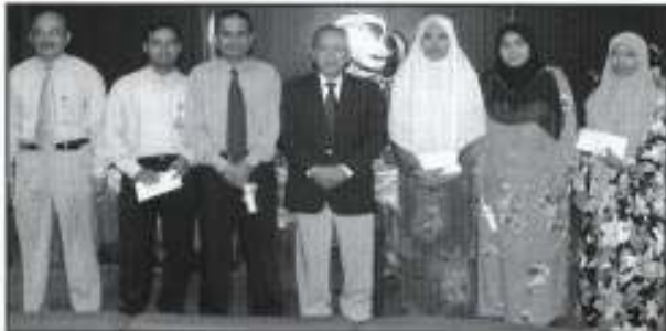
Penerima Anugerah Perkhidmatan Cemerlang bergambar berangan dengan Ketua Eksekutif Kumpulan PKINK dan Pengurus Sumber Manusia PKINK.

Dalam ucapan ringkas Ketua Eksekutif, beliau telah menyarankan agar bahagian PSM membuat kajian kemungkinan untuk memberi hadiah iringan berupa pakej lawatan dalam Malaysia untuk 2 orang kepada penerima Anugerah Perkhidmatan cemerlang untuk tahun-tahun akan datang sebagai galakan kepada setiap anggota.