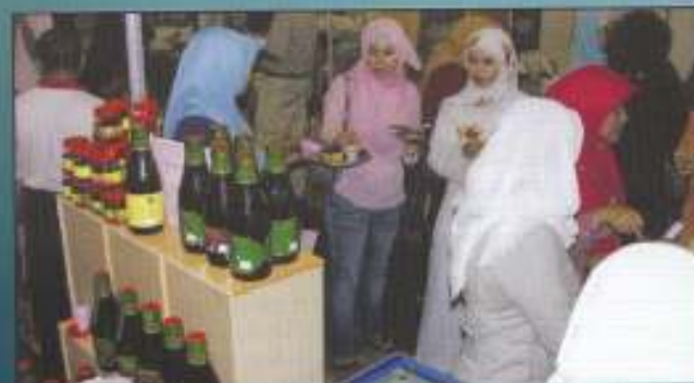
Baru Negeri Kelantan mempromosikan produk minuman roselle yang mereka