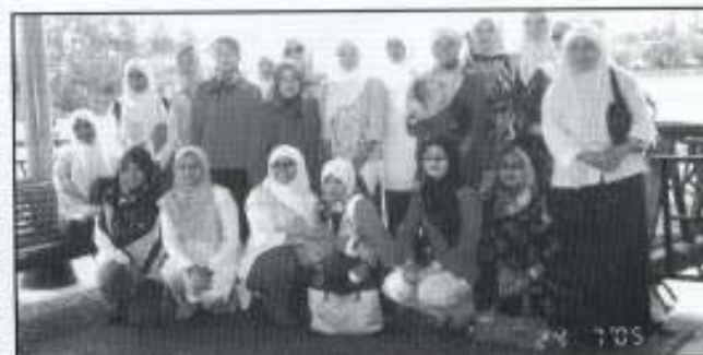
Rombongan bergambar kenangan di Water Front