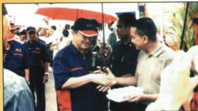
Perdana Menteri Malaysia Datuk Seri Abdullah Haji Ahmad Badawi sempat membuat kunjungan ke Rumah Kelantan sempena Perasmian Hari Peladang, Penternak dan Nelayan Peringkat Kebangsaan.

Penyertaan PKINK yang bertindak sebagai agensi peneraju pada acara ini telah menempa sejarah bagi Kerajaan Negeri Kelantan di mana buat pertama kalinya penyertaan ini telah berjaya memenangi tempat kedua untuk dua kategori yang dipertandingkan iaitu, Kategori Kerajaan Negeri Terbaik dan Kategori Pavilion Terbaik. Ucapan penutup dan penyampaian hadiah HPPNK 2005 ini telah disempurnakan oleh Menteri Besar Selangor, Datuk Seri Mohamad Khir Toyo.