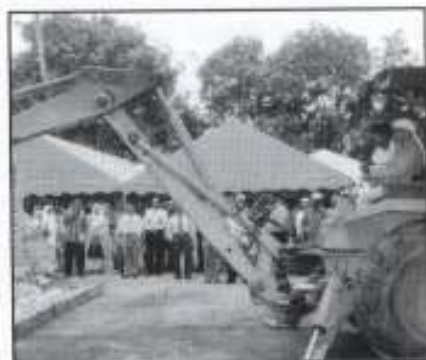
YAB Tuan Guru Menteri Besar merobohkan dinding sebagai simbol kepada pecah tanah pembinaan pejabat baru KPK.