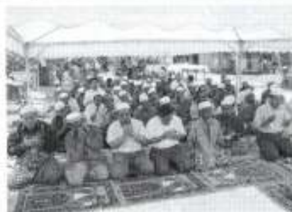
Solat Hajat memohon keberkatan sempena pengambilalihan Ladang Tapis oleh SLST

Para tetamu diraikan dengan jamuan makan tengahari serta buah-buahan tempatan. Ini diikuti oleh solat sunat hajat.