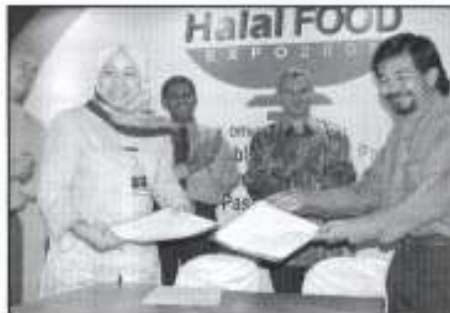
Bertukar dokumen: MOU antara pihak Mega Air Travel & Tours Pte Ltd & pihak Perdana Resort, Anak Syarikat PKINK (kiri)