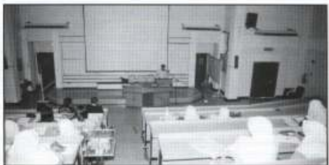
Pelajar sedang mengikuti kuliah yang sedang disampaikan oleh En. Ruzil Imaj

strategi pembudayaan keusahawanan di peringkat IPTA yang menjadi teras kepada matlamat kerajaan dalam menjayakan program pewujudan Masyarakat Perdagangan dan Perindustrian Bumiputera (MPPB) mampu direalisasikan menjelang 2010 akan datang. Selaku salah sebuah agensi utama dalam pembangunan keusahawanan di peringkat negeri, PKINK akan terus berfungsi sebagai 'developmental training provider' yang lebih holistik, efisien dan sensitif kepada kehendak dan keperluan semasa.