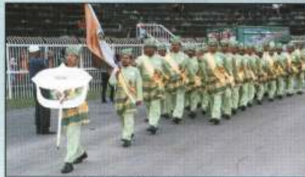
Singah berpaya dengan langkah serong pahlawan