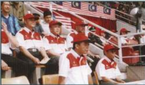
Rubai Elakul PKINK bersama di-01 jempitan

Selain dari acara perbarisan, majlis juga dimeriahkan dengan acara pertunjukan seni silat dan juga perarakan motor mini oleh kanak-kanak.