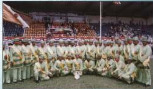
Kontinjen PKINK bergambar kenangan selepas Majlis Perbarisan Hari Kebangsaan