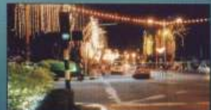
Struktur mainan budaya Kota Bharu yang diterangi cahaya