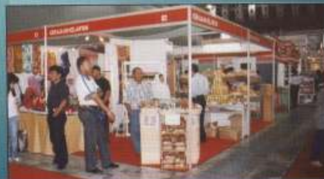
Baru Negeri Kelantan dipromosikan di gerai Perak, Perak