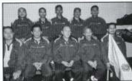
Pasukan PKINK yang diketuai oleh Ketua Eksekutif Kumpulan PKINK