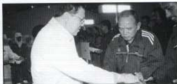
Menolak Sembah cendermahu pasukan PKINK oleh Ketua Eksekutif kepada KDYMM Al-Sultan Kelantan

Juara Kejohanan Badminton Piala Kurniaan KDYMM Al-Sultan dan Raja Perempuan Kelantan 2005 ialah pasukan KDYMM Al-Sultan dan Naib Johan ialah Pasukan SUK.