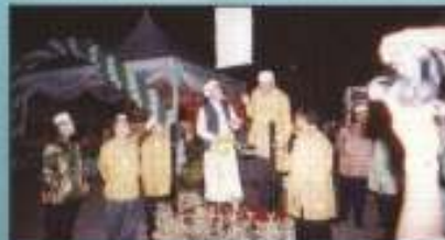
Wd Tuan Guru Menteri Besar Kelantan menyaksikan Dapud Dapungan Bandar Raya Islam