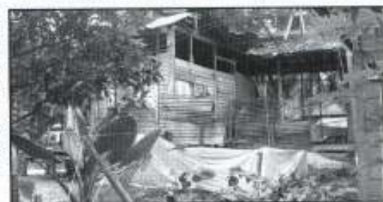
Keadaan rumah NorAzman yang dilanda ribut