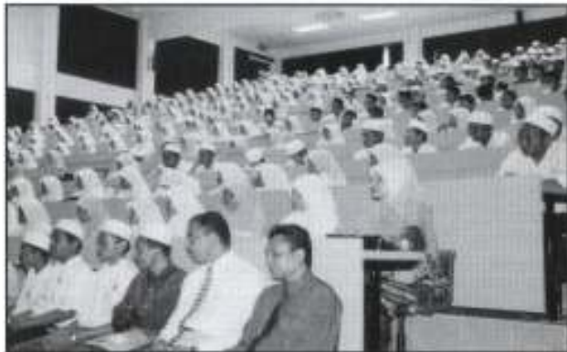
Peserta-peserta seminar keusahawanan PUM

Bahagian Pembangunan Usahawan (BPU) selaku Sekretariat PUM Negeri Kelantan telah meneruskan program latihan dengan menganjurkan Seminar Keusahawanan PUM 2005. Penganjuran seminar kali ini adalah lebih bersepadu kerana ianya dibahagikan mengikut zon membabitkan sekolah-sekolah yang mengikuti Program PUM 2005. Penyertaannya pula