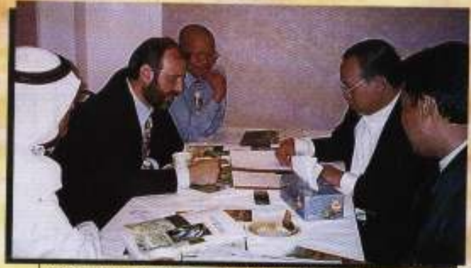
YABrs Ketua Eksekutif mengetuai 'Business Meeting' dengan Ahli Perniagaan Dubai