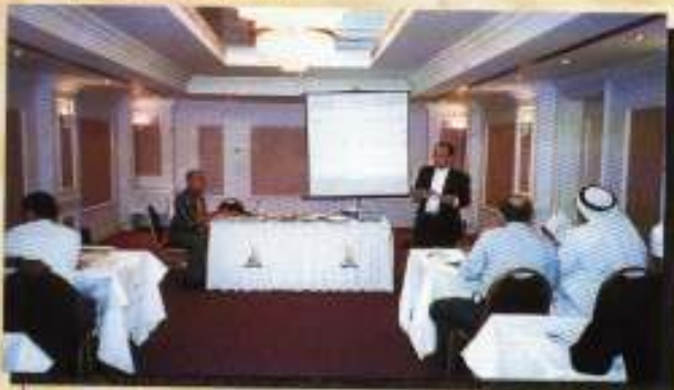
YABrs Ketua Eksekutif sedang memberi taklimat mengenai peluang-peluang pelaburan di Kelantan kepada para pelabur Dubai