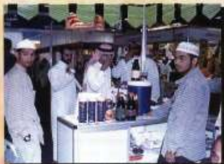
Pengunjung Pameran sedang mencuba minuman Cordial Roselle

Penyertaan Kerajaan Negeri Kelantan / Kumpulan PKINK pada kali ini dirasakan amat berjaya bagi tujuan memasarkan produk makanan ke luar negara bertepatan