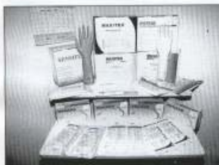
Sebahagian daripada produk yang dikeluarkan oleh Kilang Terang Nusa

Rombongan Majlis Eksekutif juga telah dibawa melawat ke sekitar kilang serta diberi penerangan oleh pegawai-pegawai Terang Nusa Sdn. Bhd. bagaimana proses membuat sarung tangan dijalankan oleh mereka. Lawatan tamat pada jam 12.30 tengahari.