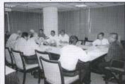
Anggota PKINK di beri penerangan cara-cara mengisi borang baru LHDN

Taklimat yang dihadiri oleh kira-kira 20 orang pegawai dan kakitangan itu selesai pada jam 4.00 petang selepas satu sesi soal jawab ringkas.