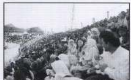
Antara ribuan rakyat yang hadir menyaksikan Istiadat Perbarisan Mengarak Panji-Panji Rejimen Pertama Artileri Di Raja Para

Anggota PKINK turut meraikan Istiadat Perbarisan Mengarak Panji-Panji Rejimen Pertama Artileri Di Raja Para Bagi Meerayakan Hari Keputeraan KDYMM Al-Sultan Kelantan.