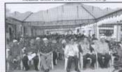
Antara jemaah yang hadir