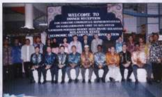
Rombongan bergambar kenangan dalam majlis makan malam di Perdana Resort