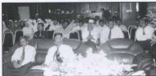
Antara anggota PKINK yang hadir semasa sesi Taklimat Kota Bharu Bandar Raya Islam

Hasrat untuk menjadikan Kota Bharu sebagai Bandar Raya Islam telah diilhamkan oleh YAB Tuan Guru Dato' Haji Nik Abdul Aziz b. Haji Nik Mat Menteri Besar Kelantan pada tahun 1992.