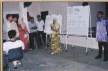
Ahli-ahli Kumpulan yang membuat persembahan