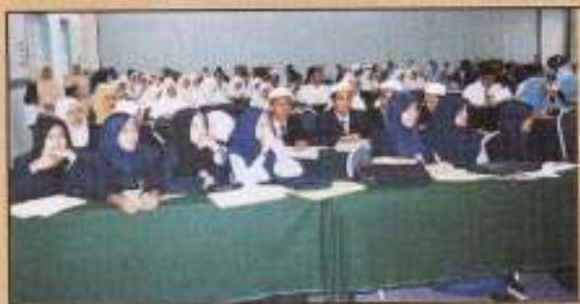
Arahan peserta yang mengikuti konvensyen

Bahagian Pembangunan Usahawan PKINK (BPU) selaku sekretariat PUM telah mengadakan Konvensyen Program Usahawan Muda Peringkat Negeri Kelantan pada 26 hingga 28 April 2005 lalu. Konvensyen selama tiga hari yang diadakan di Perdana Resort Pantai Cahaya Bulan telah disertai oleh 24 buah sekolah yang mengikuti program PUM membabitkan seramai 79 orang pelajar lelaki, 77 orang pelajar perempuan, 15 orang guru pembimbing lelaki dan 32 orang guru pembimbing wanita.