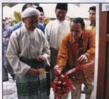
MB memotong riben sebagai tanda pelancaran rasmi penjualan Kondominium Pelangi