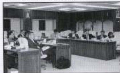
Rombongan diberi taklimat oleh UPEN dan PKINK di Kota Darulnaim