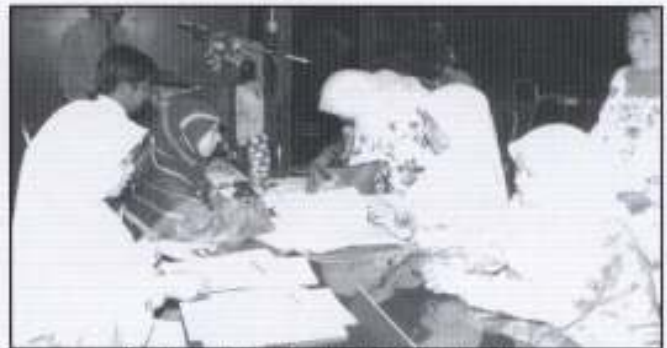
Pembeli-pembeli sedang menandatangani perjanjian jual beli KB Bazaar