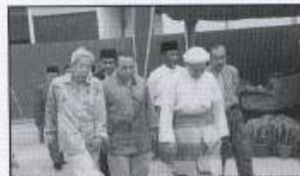
YB Tuan Guv MB dengan Ketua Eksekutif PKINK (dua dari kiri), Pengarah Finconsult (tengah) dan anggota exco. melawat 'Show House' Kondominium Pelangi

yang berasingan untuk penghuni, tempat permainan kanak-kanak dan dewan komuniti.