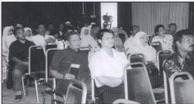
Antara yang hadir di majlis menandatangani jual beli KB Bazaar

Tiga buah bank perdagangan di sekitar bandar Kota Bharu telah hadir untuk mengurus pembiayaan ruang niaga tersebut iaitu Bank Islam, Public Bank dan Maybank.