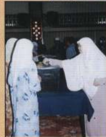
Ahli-ahli Koperasi sedang membatu wang undi bagi memilih ahli Lembaga Pengarah Koperasi yang baru