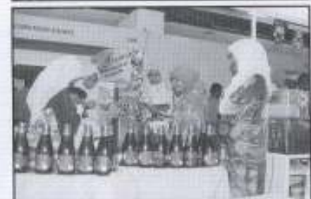
Antara barangan yang di bawa oleh PKINK sempena Ekspo Keusahawanan Nasional