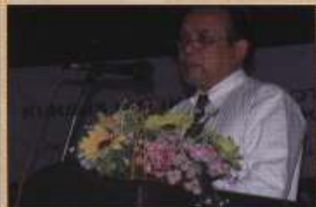
Ketua Eksekutif sedang menyanyikan ucapan