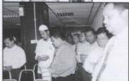
Anggota Kumpulan PKINK yang hadir bersebelah ke atas Ratu Mahamad S.A.W