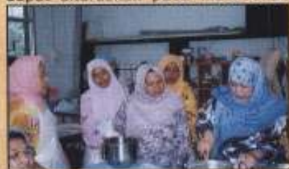
Peserta Kursus Lanjutan Memasak Kek, Biskut & Roti

Penganjuran kursus ini bukanlah sekadar peluang untuk menambah koleksi resepi sahaja tetapi ianya akan mempertingkatkan kemahiran para peserta dan boleh di komersialkan. Pada keseluruhannya kursus ini telah mendatangkan kesan serta manfaat kepada keseluruhan peserta dan mereka berharap agar kursus seumpama ini dapat diteruskan pada masa akan