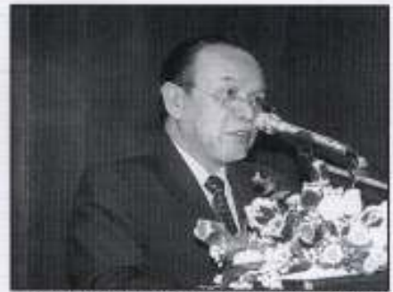
Ketua Eksekutif Kumpulan PKINK menyampaikan Taklimat di Majlis Menandatangani jual beli KB Bazaar

Dari jumlah 212 unit ruang niaga yang ditawarkan, sebanyak 87 unit telah dijual. Harga-harga yang ditawarkan ialah antara RM90,000 hingga RM151,000.00 se lot.