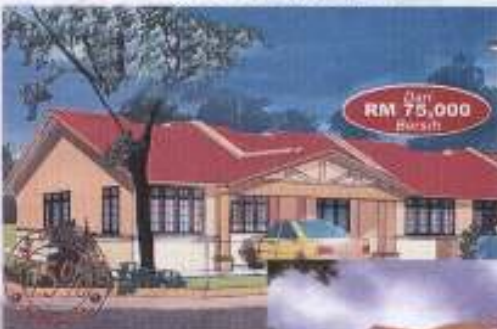
Banglo 1 tingkat