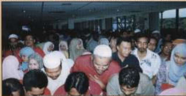
Ahli-ahli yang hadir sedang mematuhi eluan kehadiran