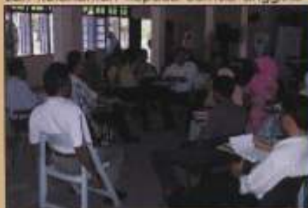
Bengkel kerja berkursus