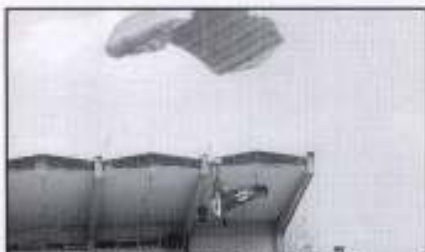
Peneraju sedang membawa bendera Kelantan

Satu istiadat mengarak panji-panji Regimen Pertama Artileri Di Raja Para telah diadakan di Stadium Sultan Muhammad IV, Kota Bharu pada 16 April lalu.