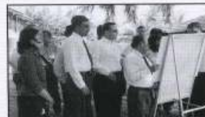
Rombongan diberi penerangan oleh Ketua Eksekutif Kumpulan PKINK mengenai cadangan pembinaan 'supply base area' di Tumpat