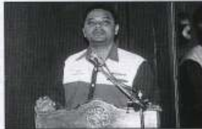
Wakil dari Wasiyyah Shoppe menyampaikan taklimat