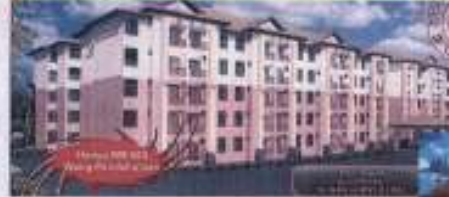
Pangsapuri Sri Kemumin 5 tingkat berlif.