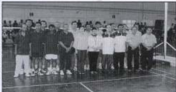
Bergambar bersama DYMM Raja Permaisuri Kelantan sebelum pertandingan akhir dimulakan

Sambutan kejohanan tersebut amat menggalakkan walaupun ianya pertama kali diadakan, di mana seramai 41 pasukan telah menghantar penyertaan.