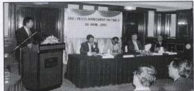
Majlis menandatangani perjanjian antara SBC setiap Negeri dengan Telco diadakan di Hotel Palace of Golden Horses