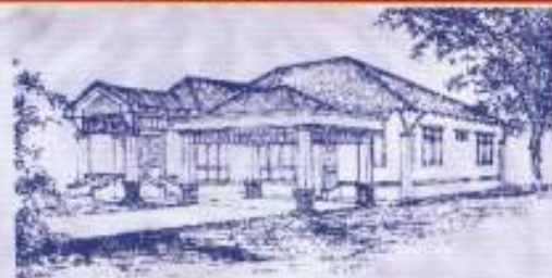
18 unit Banglo 1 tingkat Pengkalan Chepa Kota Bharu.