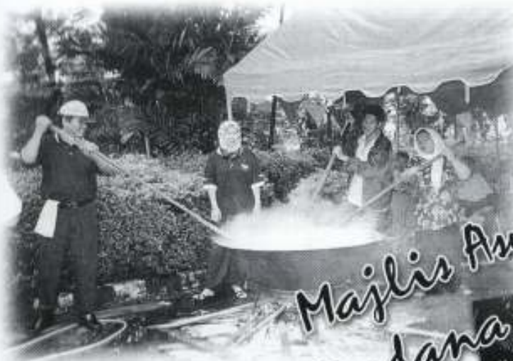
Majlis Asyura Perdana 1424

Bagi lain-lain aktiviti, ahli-ahli boleh mendapatkan maklumat terkini melalui Pengerusi-Pengerusi Jawatankuasa Kecil yang mana aktiviti-aktiviti akan dirangka dan dijalankan dari semasa ke semasa.