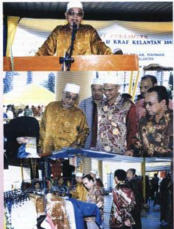
Sepanjang 7 hari penganjuran karnival tersebut, booth-booth pameran sentiasa menjadi kunjungan terutamanya para pelancong dan berseesuaian pada musim cuti persekolahan.