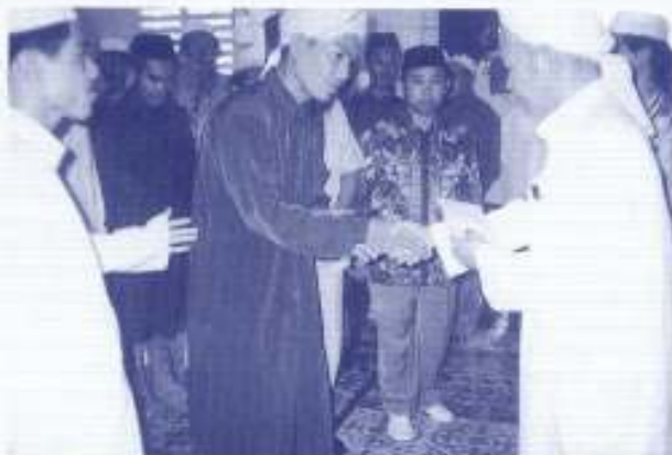
MB menyampaikan sumbangan kepada fakir miskin di Masjid KMB

Katanya kami di sini sudah ketandusan ulamak selepas perang indochina boleh dikatakan semua ulamak mati dibunuh oleh tentera Khmer Rough.