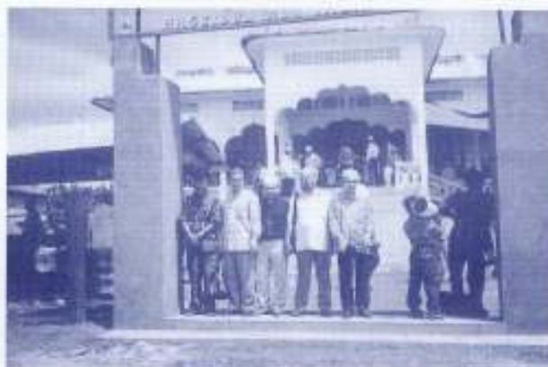
Di hadapan Masjid Kg. Cham.