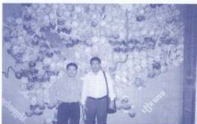
Di hadapan limbunan tengkorak tempat pembunuhan oleh Rajim Poi Pot.

Katanya rakyat Malaysia akan rugi besar jikalau pemimpin dan tokoh ulamak seperti itu ditolak atas kepentingan politik yang tidak berlandaskan Islam. ■