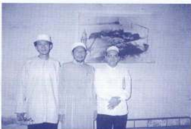
Kem Taharan di penyeksan Rajim Poi Pot.

Katanya rakyat Malaysia akan rugi besar jikalau pemimpin dan tokoh ulamak seperti itu ditolak atas kepentingan politik yang tidak berlandaskan Islam. ■