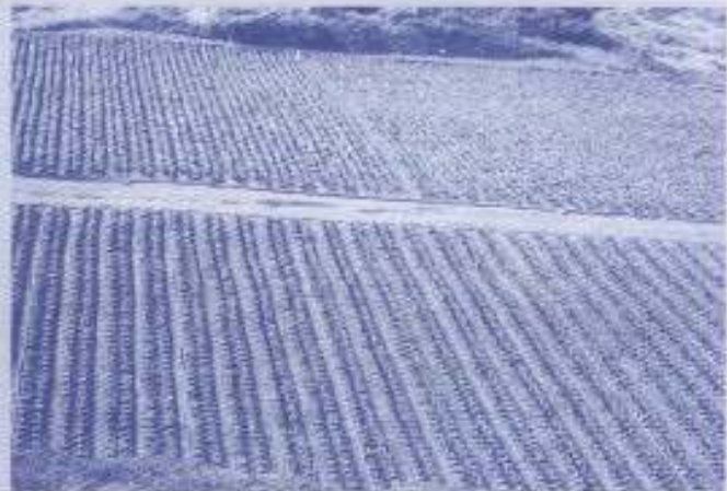
Sebahagian dari ladang sayur-sayuran KPKB di Lojing, Hulu Kelantan.

dan sehingga kini telah membelanjakan sebanyak RM1.2 juta bagi menyediakan kemudahan asas dan tapak tanah ladang. Lebih kurang 50 ekar kawasan pertanian yang dimajukan telah mengeluarkan hasil dan di antaranya tomato, kobis, kailan dan lain-lain jenis sayur-sayuran. Pada masa ini hanya sebahagian kecil sayur-sayuran tersebut mampu dipasarkan untuk pasaran tempatan kerana masalah jalan perhubungan yang sukar. Sebahagian besar sayur-sayuran tersebut dihantar ke Pasar Borong Selayang dan juga untuk pasaran di utara Semenanjung. Adalah dijangkakan apabila lebuh raya kedua Timur-Barat yang melalui Tanah Tinggi Lojing yang dijangka siap pada tahun 2002, membolehkan sayur-sayuran tersebut dipasarkan sepenuhnya kepada penduduk di sebelah utara Kelantan. Berdasarkan potensi tersebut, KPKB berharap mendapatkan peruntukan tanah pertanian yang lebih luas lagi pada masa akan datang bagi membolehkan projek yang lebih besar dapat dilaksanakan. KPKB kini mempunyai pengalaman di bidang pertanian di samping mempunyai sumber modal dan pasaran.