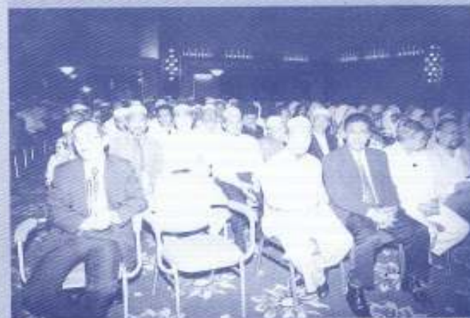
Anggota-anggota Exco Kerajaan Negeri dan di-di-jemputan di majlis pelancaran pemakaian takwim dan Kalendar Hijrah bagi peringkat Kumpulan PKINK di Hotel Perdana.