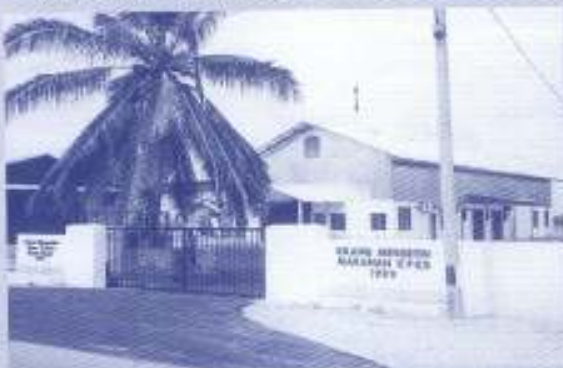
Kilang Mengetin Makanan KPKB yang terletak di Bachok, Kelantan.