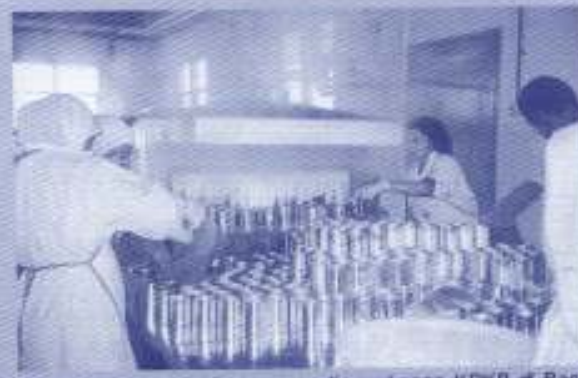
Operasi pengeluaran di kilang mengetin makanan KPKB di Bachok, Kelantan.