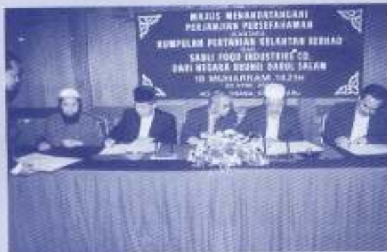
Majlis menandatangani MOU di antara KPKB dan SABL FOOD INDUSTRIES CO. dari negara Brunei Darussalam.

Aktiviti hiliran yang dijalankan ini adalah untuk membuka ruang pasaran yang lebih luas kepada produk dan bahan mentah yang sedia ada yang terdapat di Kelantan. Ia juga sudah tentu memberi sumbangan pendapatan yang lebih kepada petani-petani. Oleh itu, pengujudan kilang mengetin makanan ini adalah bertepatan sekali dengan hasrat membangunkan sektor pertanian di Kelantan yang menjurus kepada pengeluaran bahan makanan halal sebagaimana yang dihasratkan oleh Kerajaan Negeri Kelantan.