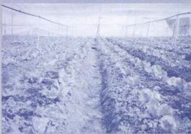
Tanaman sayur-sayuran juga dilakukan di bawah "Rumah Kelambu" bagi mengelakkan penggunaan racun serangga dan lain-lain

Melalui syarikat anak milik sepenuhnya, Ladang Darulnaim Sdn. Bhd (LDSB), KPKB telah mengadakan usahasama dengan sebuah syarikat swasta pada 1999